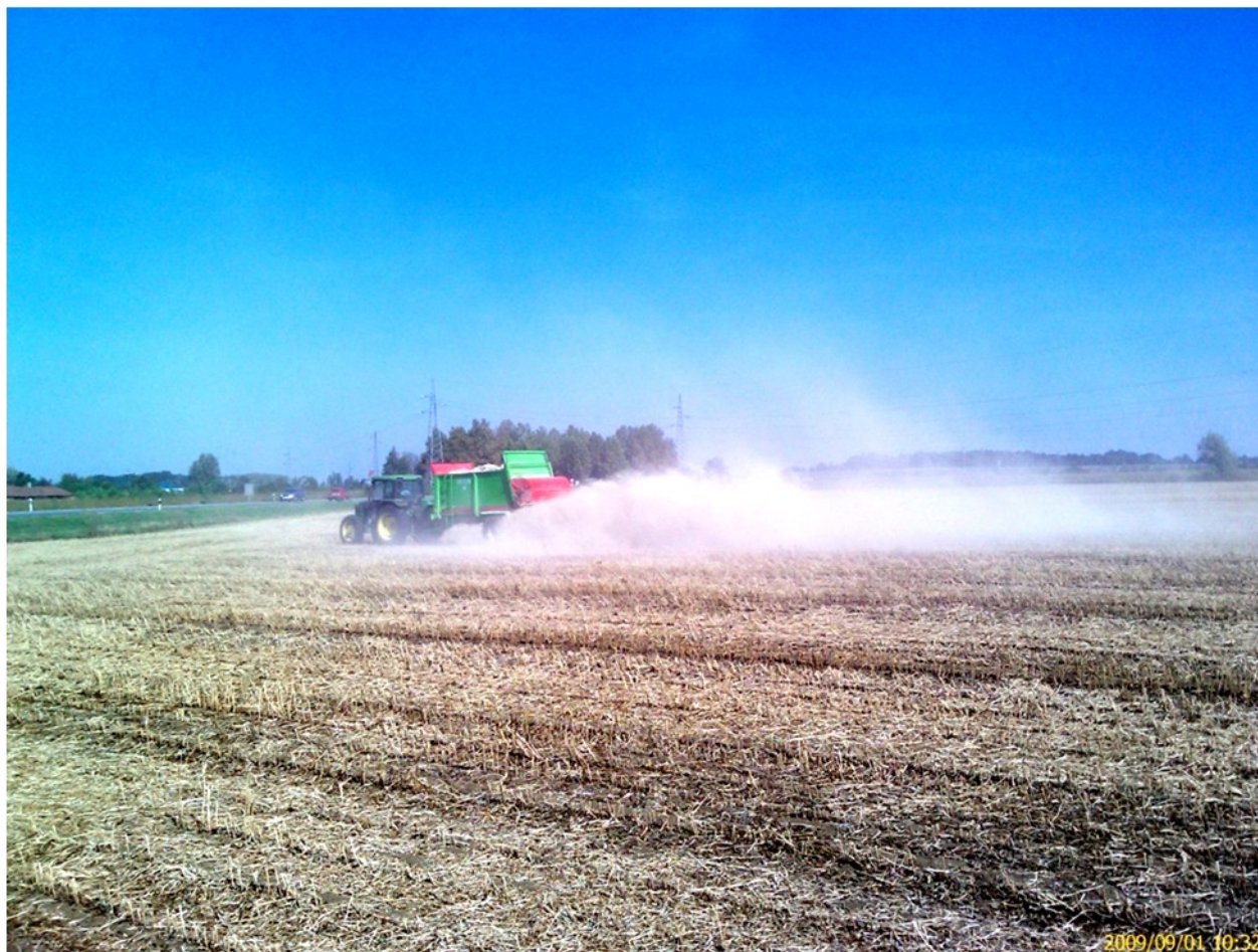
Slika 2. Kalcizacija (primjena karbokalka ljeti po strništu; Vukadinović, 2011. )

Infekcija tla patogenim mikroorganizmima je pojava do koje dolazi kod primjene svježih gnojovki sa stočnih farmi na kojima se javljaju bolesti. Nema podataka o takvim infekcijama u našoj zemlji, a uporaba ovih gnojiva zakonski je posebno regulirana .